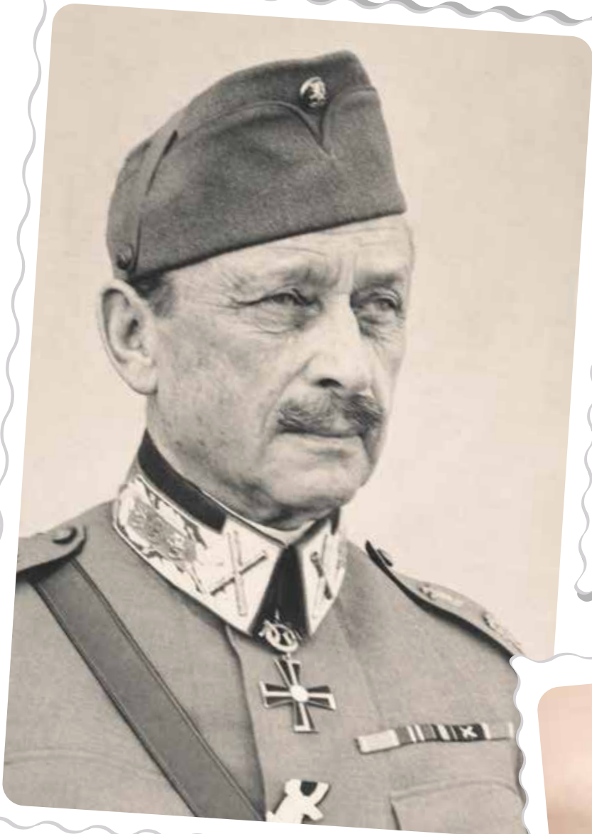
Tasavallan presidentin kanslia/Mannerheim