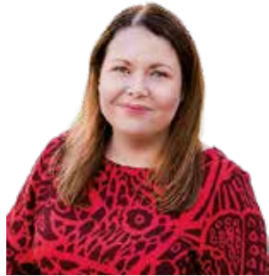
Tuija Kautto Nuorisoala ry

Paljoa en tiedä, mutta sen, mutta sen tiedän, että ilman nuoria itsenäisyys ei paljoakaan merkitse. Jotta meillä olisi tulevaisuudessa Suomi, jonka puolesta toimia, tarvitaan nuoria. Meidän on kyettävä pitämään paremmin huolta nuorten hyvinvoinnista, tarjottava edellytyksiä kasvaa ja kehittyä sekä pidettävä huolta, ettei yksikään nuori putoa kyydistä. Haluan, että Suomeni on myös tulevaisuudessa maailman paras paikka elää ja kasvaa.